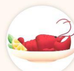
上菜流程順序 中式