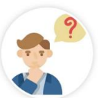
單元四 顧客反對問題與突發狀況