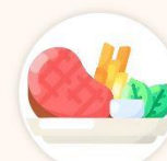
上菜流程順序 西式