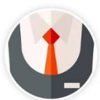
單元二 服儀規定/SET桌擺放方式