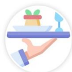
單元三 上菜規則與順序